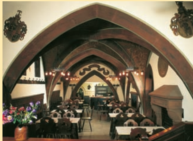
Dominikanerklausur mit gotischem Gewölbe aus dem Jahre 1310

Ob Frühschoppen, Brotzeit, Mittagessen, Vesper oder abendliche Einkehr – die Gästeschar ist, frei nach dem Herrn Geheimrat Goethe, ein „bunt Gewimmel“ aus Männlein und Weiblein verschiedenster Couleur. Dem Dichter des „Faust“ könnte der Ausruf seines Titelhelden „Das ist des Volkes wahrer Himmel, hier bin ich Mensch, hier darf ich's sein!“ im Schlenkerla eingefallen sein.