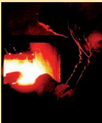
Historische Malztrocknung über einem offenem Buchenholzfeuer im Schlenkerla

Zur Herstellung des Rauchmalzes werden Buchenholzscheite verbrannt, die mindestens drei Jahre gelagert wurden. Dieses Holz erster Qualität, geschlagen im Fränkischen Jura, verleiht letztlich dem „Aecht Schlenkerla Rauchbier“ sein spezielles Aroma und seine dunkle Farbe. Das nach frischem Geräucherten schmeckende, untergärige Märzenbier mit 13,5% Stammwürze hat einen Alkoholgehalt von etwa 5,1%. Daß es ein ganz besonderes Bier ist, verdankt es der Kunst der „Bräuer“. Über drei Jahrhunderte hinweg haben sie ihr Können und ihre Erfahrungen bei der rechten Vermischung der Naturstoffe zu dem bekömmlich-berauschenden Getränk namens Rauchbier weitervererbt bis in die Gegenwart. Dies zeigt sich heute an zahlreichen nationalen und internationalen Auszeichnungen.